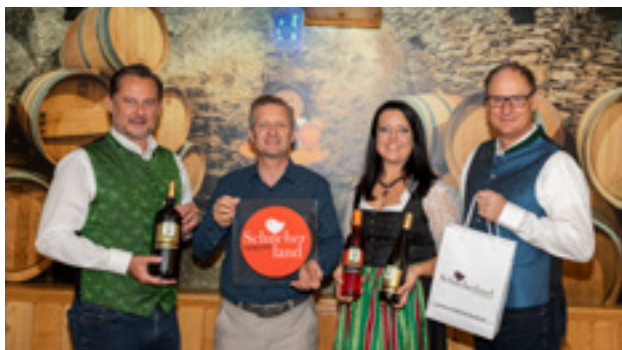
Wein- und Genusswelt Garber