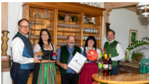
Weinbau & Buschenschank Glirsch