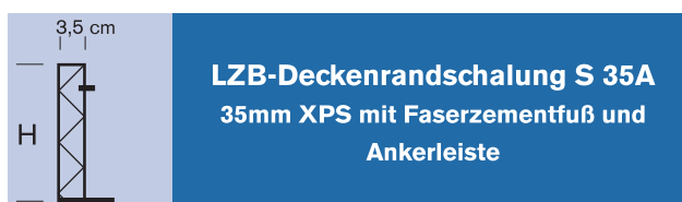
LZB-Deckenrandschalung S 35A 35mm XPS mit Faserzementfuß und Ankerleiste