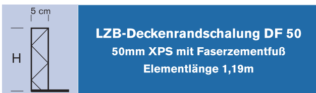
LZB-Deckenrandschalung DF 50 50mm XPS mit Faserzementfuß Elementlänge 1,19m