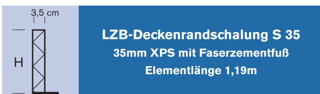
LZB-Deckenrandschalung S 35 35mm XPS mit Faserzementfuß Elementlänge 1,19m