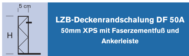
LZB-Deckenrandschalung DF 50A 50mm XPS mit Faserzementfuß und Ankerleiste