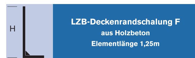
LZB-Deckenrandschalung F aus Holzbeton Elementlänge 1,25m