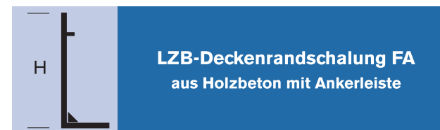
LZB-Deckenrandschalung FA aus Holzbeton mit Ankerleiste