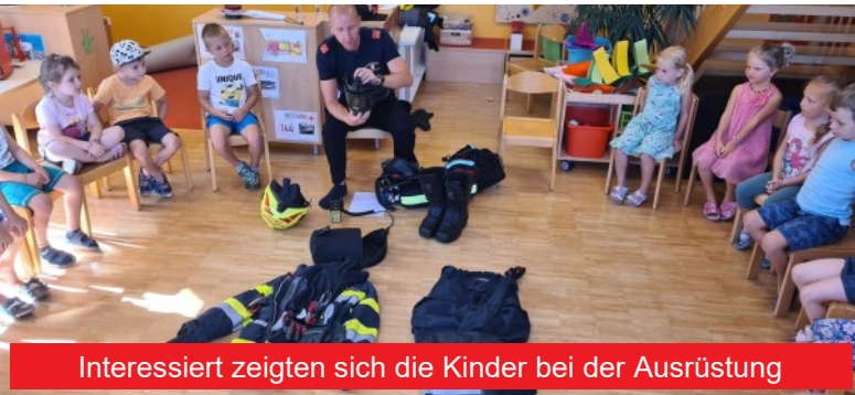
Interessiert zeigten sich die Kinder bei der Ausrüstung