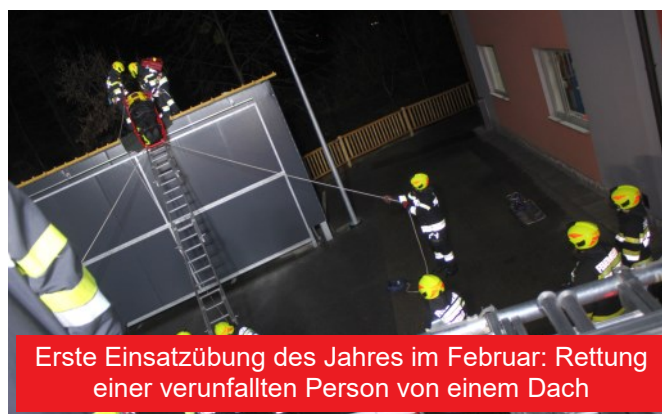
Erste Einsatzübung des Jahres im Februar: Rettung einer verunfallten Person von einem Dach

überörtlich in Übungen eingebunden, zweimal davon auf Abschnittsebene, einmal bei der großangelegten Katastrophenhilfsdienstübung auf der Weinebene im Oktober, an der ein Trupp der Menschenrettung und Absturzsicherung teilnahm.