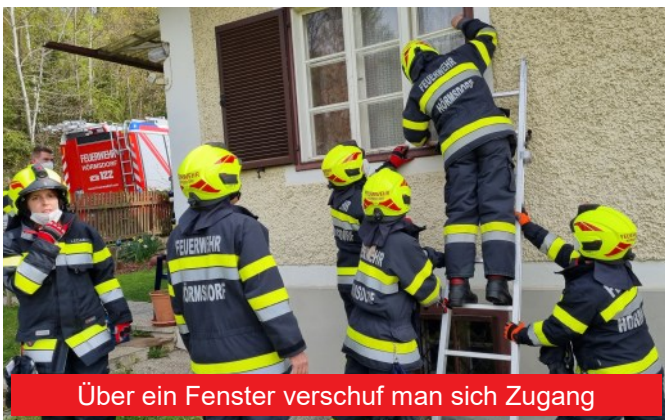
Über ein Fenster verschuf man sich Zugang

Acht Mitglieder mit Tanklösch- und Mannschaftstransportfahrzeug, darunter ein Feuerwehrmann, welcher gleichzeitig First Responder beim Roten Kreuz ist, rückten wenig später zur Einsatzstelle aus. Vor Ort waren Angehörige sowie die Polizei, die 98-jährige allein lebende Hausbewohnerin konnte sich hinter einem Fenster bemerkbar machen. Sie dürfte gestürzt sein und kam von selbst nicht mehr auf die Beine.