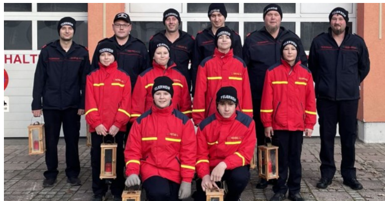
2022 konnte das Friedenslicht wieder an die Haushalte in Hörnsdorf und Feisternitz verteilt werden

Am 24.12. konnte das Licht dann wieder, wie vor der Pandemie üblich, als Zeichen der Hoffnung und des Friedens, besonders in den aktuell herausfordernden Zeiten ein wichtiges Symbol, an die Haushalte im Löschbereich verteilt werden.