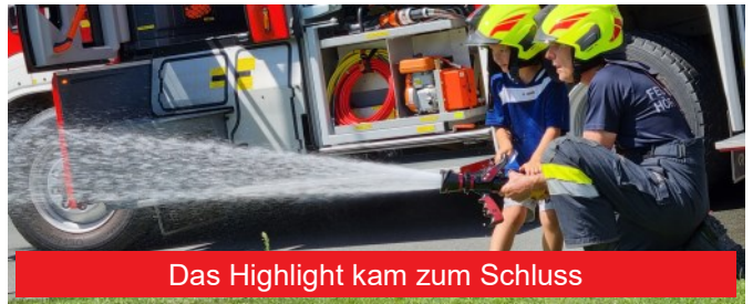
Das Highlight kam zum Schluss

schwerem Atemschutz adjustiert, um ihnen eine mögliche Angst im Ernstfall vor den verummten Einsatzkräften zu nehmen, die ihnen zu Hilfe kommen wollen.