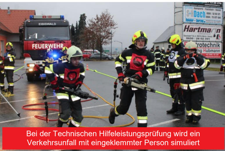
Bei der Technischen Hilfeleistungsprüfung wird ein Verkehrsunfall mit eingeklemmter Person simuliert