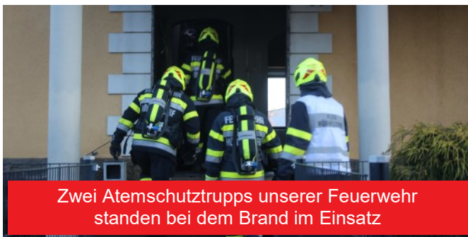
Zwei Atemschutztrupps unserer Feuerwehr standen bei dem Brand im Einsatz

Unsere Feuerwehr rückte mit Tanklösch- und Kleinlöschfahrzeug mit insgesamt zwölf Kameradinnen und Kameraden zum Einsatzort an unserer unmittelbaren Löschbereichsgrenze zur FF Pitschgau-Haselbach aus. Vor Ort wurde zunächst ein umfassender Löschangriff von außen bzw. unter schwerem Atemschutz von innen vorgenommen. Das Feuer war rasch unter Kontrolle, allerdings hielt sich der Brand hartnäckig in der Zwischendecke zwischen Erd- und Obergeschoss, was den Einsatz zahlreicher Atemschutztrupps zum Öffnen des Bereichs und Ablöschen des Brandes erforderlich machte. Unter anderem waren zwei Trupps unserer Feuerwehr im Einsatz. Die Wasserversorgung während der Löscharbeiten wurde von zwei unmittelbar neben dem Brandobjekt gelegenen Hydranten sichergestellt.