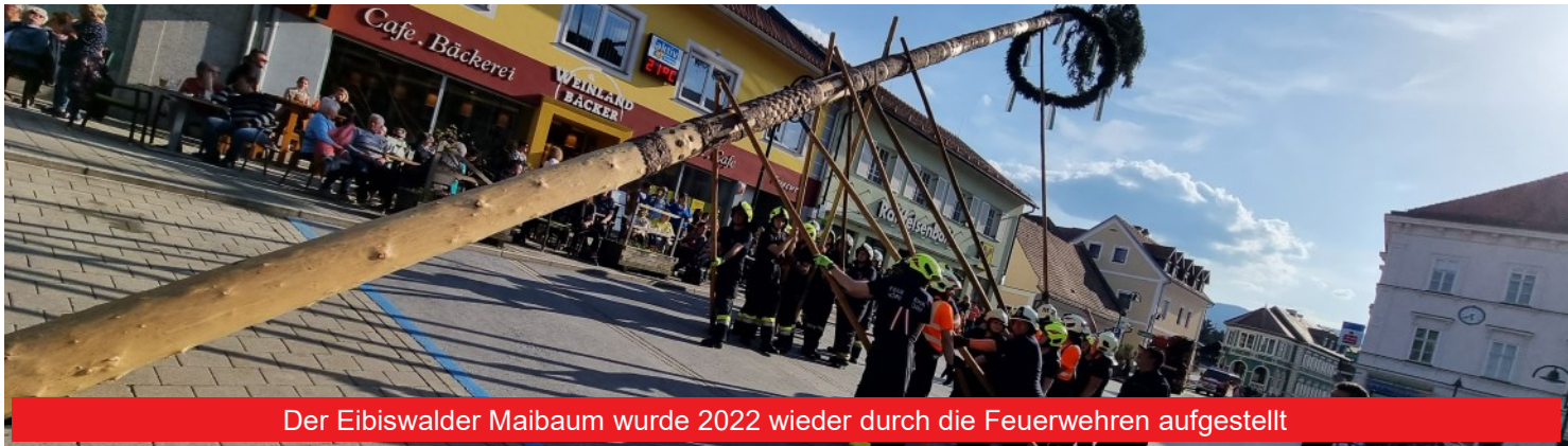
Der Eibiswalder Maibaum wurde 2022 wieder durch die Feuerwehren aufgestellt