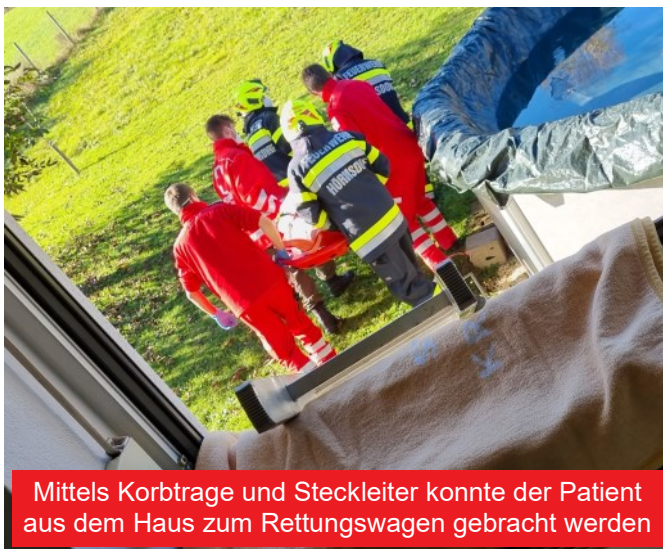
Mittels Korbtrage und Steckleiter konnte der Patient aus dem Haus zum Rettungswagen gebracht werden

Bei unserem Eintreffen wurde uns mitgeteilt, dass der Mann stabil wäre, die Sanitäter aufgrund des engen Stiegenhauses aber keine Möglichkeit sahen, ihn mit ihrer Trage zum Rettungswagen zu bringen. Gemeinsam mit unserem Einsatzleiter wurde entschieden, ihn direkt über sein Zimmerfenster mittels Korbtrage und Leiter aus dem Haus zu bringen.