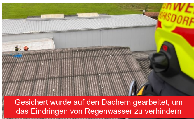
Gesichert wurde auf den Dächern gearbeitet, um das Eindringen von Regenwasser zu verhindern

Die letzte Einsatzadresse gestaltete sich etwas langwieriger. Hier musste eine Seilsicherung von zwei Seiten auf das Dach eines Wirtschaftsgebäudes aufgebaut werden. Auch hier wurde mit PU-Schaum abgedichtet, jedoch musste dies von außen erfolgen. Drei Kameraden wurden am Dach bei den Arbeiten vom Rest der Mannschaft gesichert. Nach knapp sechs Stunden konnten wir uns, nach dem Reinigen und Instandsetzen der Ausrüstung, wieder einsatzbereit melden.