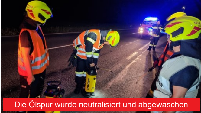
Die Ölspur wurde neutralisiert und abgewaschen

Um 22.12 Uhr wurden wir von der FF Eibiswald zur Unterstützung nachalarmiert, nachdem diese bereits um 21.57 Uhr alarmiert worden war und sich das Ausmaß der Ölspur nach Erkundung doch als recht umfangreich erwies. Kurz nach uns rückte auch noch die FF Wies zum selben Einsatz aus und konnte auch gleich den Verursacher ausfindig machen, der im Löschbereich der FF Wies liegen geblieben war: ein Traktor.