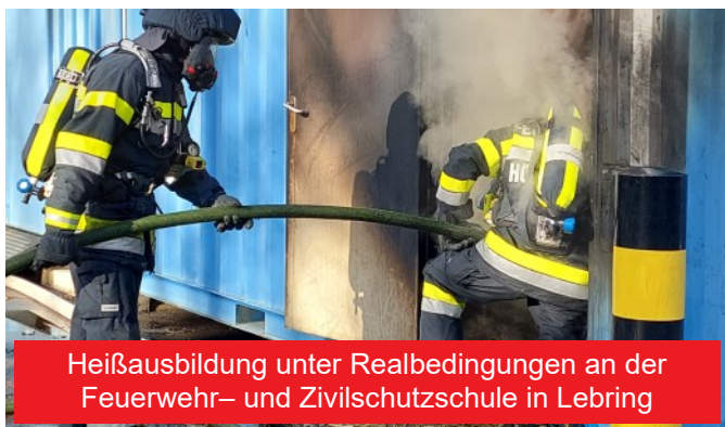
Heißausbildung unter Realbedingungen an der Feuerwehr- und Zivilschutzschule in Lebring

Nach und nach startete man dann aber wieder mit den Einsatzübungen und den Gruppenschulungen. Auch die Menschenrettungs- und Absturzsicherungsgruppe führte wieder ihre Übungen aus, ebenso wie die Atemschutzgeräteträger insgesamt fünfmal Übungen und Leistungsüberprüfungen durchführten.