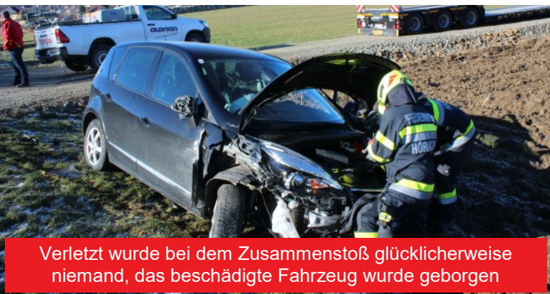
Verletzt wurde bei dem Zusammenstoß glücklicherweise niemand, das beschädigte Fahrzeug wurde geborgen

Eine Lenkerin wollte auf der Geraden in Richtung Oberhaag einen Sattelschlepper mit Tieflader überholen, allerdings bog dieser nach links in eine Baustellenein- und ausfahrt ab. Es kam zu einer Kollision, bei der der PKW schwer beschädigt und links in den Straßengraben geschleudert wurde.