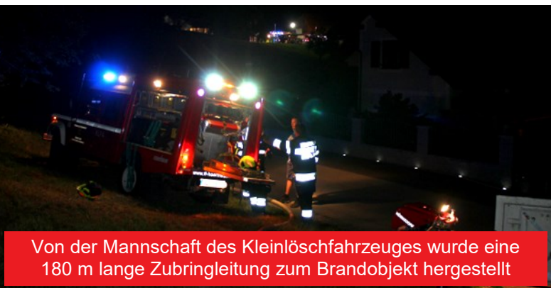
Von der Mannschaft des Kleinlöschfahrzeuges wurde eine 180 m lange Zubringleitung zum Brandobjekt hergestellt

Ort sicherzustellen. Das Feuer war so recht rasch unter Kontrolle. Nach rund dreieinhalb Stunden konnten wir die Einsatzbereitschaft wiederherstellen. Das Gebäude wurde ein Raub der Flammen, auch einige Hühner verendeten in dem Feuer. Insgesamt waren 97 Feuerwehrleute mit 17 Fahrzeugen sowie Polizei und Rotes Kreuz vor Ort.