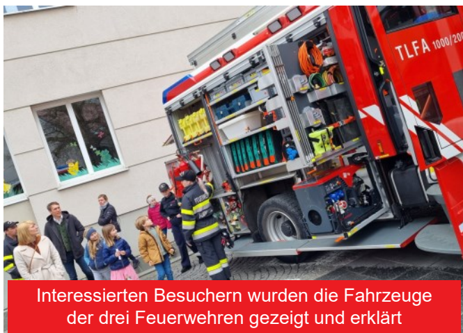
Interessierten Besuchern wurden die Fahrzeuge der drei Feuerwehren gezeigt und erklärt

Ein ereignisreiches Wochenende ging für die Feuerwehrkameradinnen und Feuerwehrkameraden mit dem Florianisonntag am 01.05.2022 zu Ende.