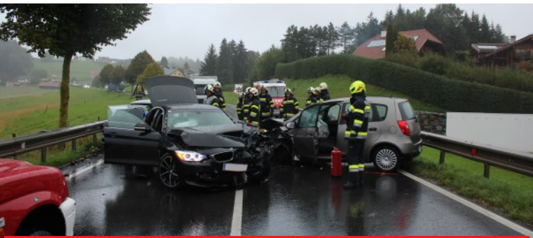
Ein Überholmanöver löste den Verkehrsunfall aus