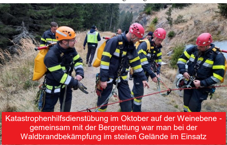
Katastrophenhilfsdienstübung im Oktober auf der Weinebene - gemeinsam mit der Bergrettung war man bei der Waldbrandbekämpfung im steilen Gelände im Einsatz

Das Jahr startete allerdings zunächst mit Onlineschulungen der Gerätekunde unserer Fahrzeuge und in der Ersten-Hilfe, da zu diesem Zeitpunkt aufgrund der Einschränkungen ein anderer Übungsbetrieb nicht sicher war.