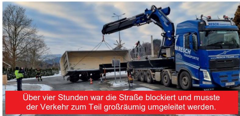
Über vier Stunden war die Straße blockiert und musste der Verkehr zum Teil großräumig umgeleitet werden.

waren unsere Einsatzkräfte vor Ort, bevor die Straße wieder für den Verkehr freigegeben werden konnte.