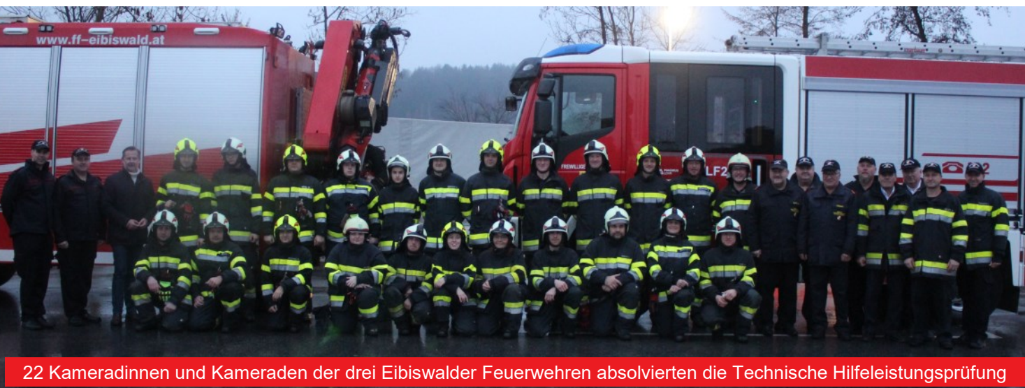
22 Kameradinnen und Kameraden der drei Eibiswalder Feuerwehren absolvierten die Technische Hilfeleistungsprüfung