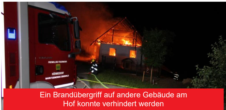
Ein Brandübergriff auf andere Gebäude am Hof konnte verhindert werden

Im Einsatzverlauf wurde auch noch die FF Oberhaag mit dem Wassertankfahrzeug alarmiert, um die Wasserversorgung vor