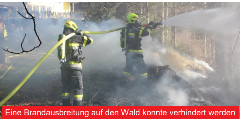
Eine Brandausbreitung auf den Wald konnte verhindert werden

Mit dem Alarmstichwort "B09 - Wald-, Heckenbrand" wurden wir am 18.02.2022 um 13.03 Uhr per Sirene zum Einsatz alarmiert. Ein größerer Kompost- und Staudenhaufen war in Hörmsdorf in Brand geraten, dieser drohte auf den angrenzenden Wald und weitere benachbarte Objekte überzugreifen. Die Besitzer reagierten glücklicherweise rasch und richtig, setzten nach Brandentdeckung einen Notruf ab und begannen mittels Eimer, mit denen sie Wasser aus einem daneben gelegenen Teich schöpften, den Brand zu bekämpfen, während sich neun Mann unserer Feuerwehr mit dem Kleinlösch- und Tanklöschfahrzeug auf den Weg zum Einsatzort machten.