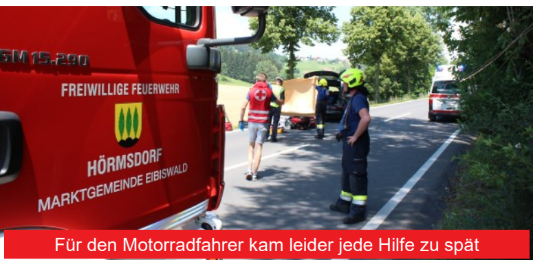
Für den Motorradfahrer kam leider jede Hilfe zu spät