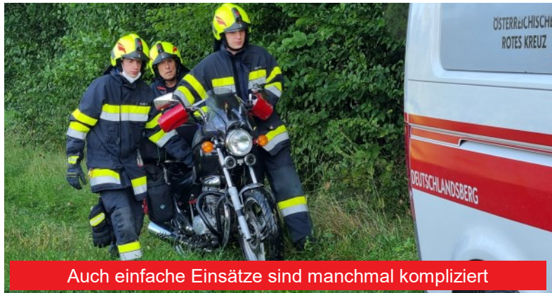
Auch einfache Einsätze sind manchmal kompliziert

Vor Ort wurde uns vom bereits anwesenden Roten Kreuzes mitgeteilt, dass der Verunfallte mit seinem Fahrzeug zu Sturz gekommen und unter seinem Motorrad eingeklemmt, aber bereits befreit war, unverletzt sei und lediglich das Unfallfahrzeug aus dem Gelände zu bergen wäre. Dies konnte von der ausgerückten Mannschaft rasch erledigt werden.