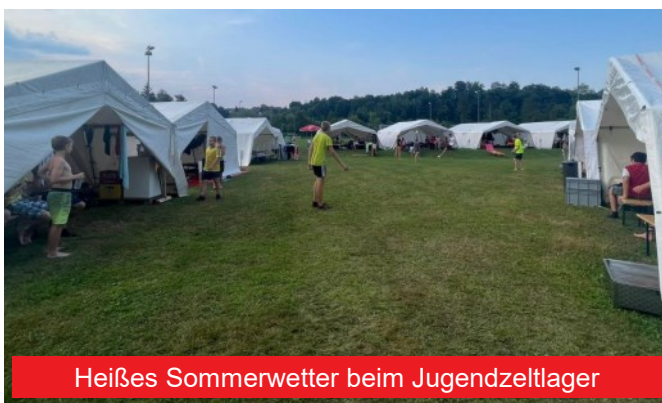
Heißes Sommerwetter beim Jugendzeltlager

Direkt angrenzend an den Sportplatz Frauental schlugen 186 Jugendliche und Betreuer der Freiwilligen Feuerwehren des Bereichsfeuerwehrverbandes Deutschlandsberg am Abend des 21.07. ihr Zeltlager auf, darunter auch sechs Jugendliche und zwei Betreuer unserer Feuerwehr.