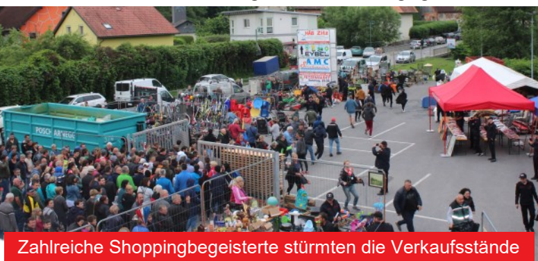
Zahlreiche Shoppingbegeisterte stürmten die Verkaufsstände

Eine Woche zuvor waren 34 Kameradinnen und Kameraden im Löschbereich unterwegs, um noch gebrauchsfähige Gegenstände, die nicht mehr benötigt werden, zu sammeln. Den ganzen Tag waren acht Trupps mit den Traktoren unterwegs und füllten die Fahrzeughalle sowie das Lagergebäude.