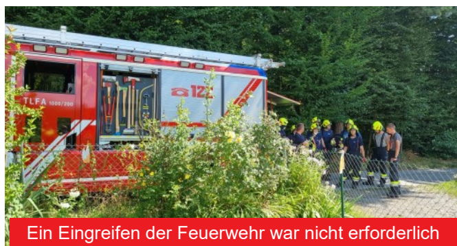
Ein Eingreifen der Feuerwehr war nicht erforderlich

Es standen elf Feuerwehrleute mit zwei Fahrzeugen im Einsatz, die nach rund 15 Minuten wieder einrücken konnten.