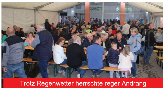
Trotz Regenwetter herrschte reger Andrang

Am 27. und 28.05. folgten dann die Aufbauarbeiten. Den