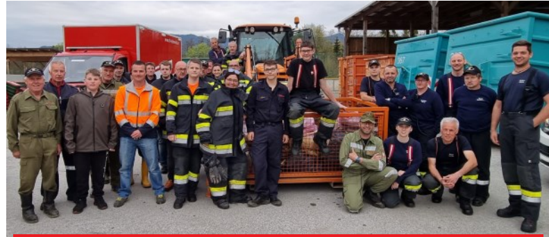
34 Kameradinnen und Kameraden der drei Feuerwehren waren an diesem Tag für den Umweltschutz im Einsatz

Aber nicht nur unsere Mitglieder standen im Einsatz, die FF Eibiswald und die FF Pitschgau-Haselbach sorgten in ihren Bereichen ebenso für die Müllentsorgung entlang und in der Saggau. 34 Kameradinnen und Kameraden der drei Feuerwehren engagierten sich an diesem Tag und wurden abschließend dafür von der Gemeinde mit einem Essen belohnt.