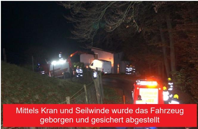
Mittels Kran und Seilwinde wurde das Fahrzeug geborgen und gesichert abgestellt

Nach rund drei Stunden wurde die Einsatzbereitschaft wieder hergestellt.