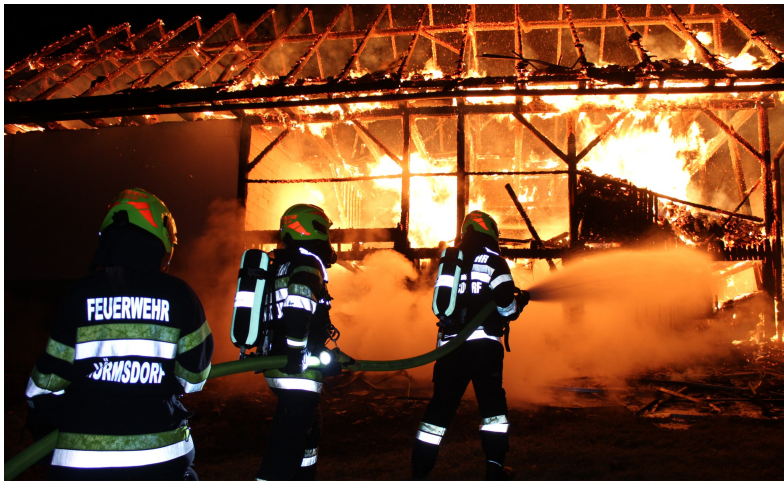
Das Gebäude stand beim Eintreffen bereits in Vollbrand

Bereits auf der Anfahrt war der Feuerschein deutlich sichtbar, an der Einsatzstelle konnte man aber rasch feststellen, dass es sich beim Brandobjekt nicht um ein Wohn- sondern "nur" um ein Nebengebäude handelte. Da dieses in einiger Entfernung vom Wirtschaftsgebäude und dem Wohngebäude stand, waren diese nicht massiv gefährdet.