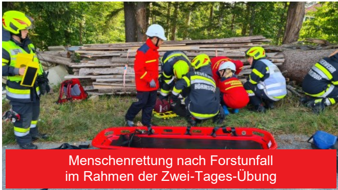
Menschenrettung nach Forstunfall im Rahmen der Zwei-Tages-Übung

Am 06. und 7.08. schlugen unsere Jugendlichen und einige Betreuer ihr Lager im Rüsthaus für die Zwei-Tages-Übung auf.