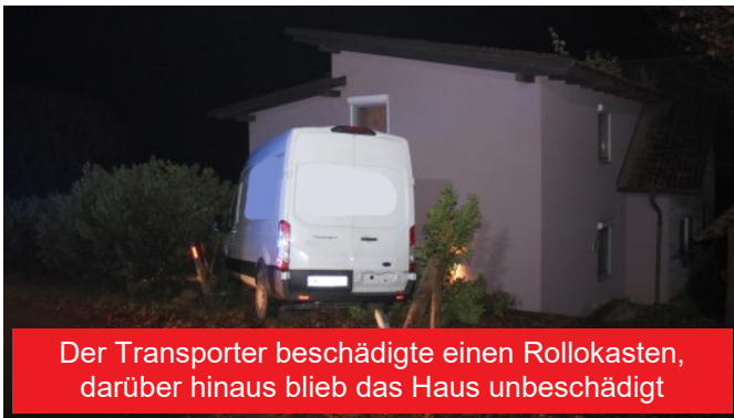
Der Transporter beschädigte einen Rollokasten, darüber hinaus blieb das Haus unbeschädigt

Am Abend des 14.11. wurde unser Kommandant telefonisch über einen verunfallten Pakettransporter informiert. Wenig später rückten 14 Mann nach einem stillen Alarm zur Fahrzeugbergung aus.