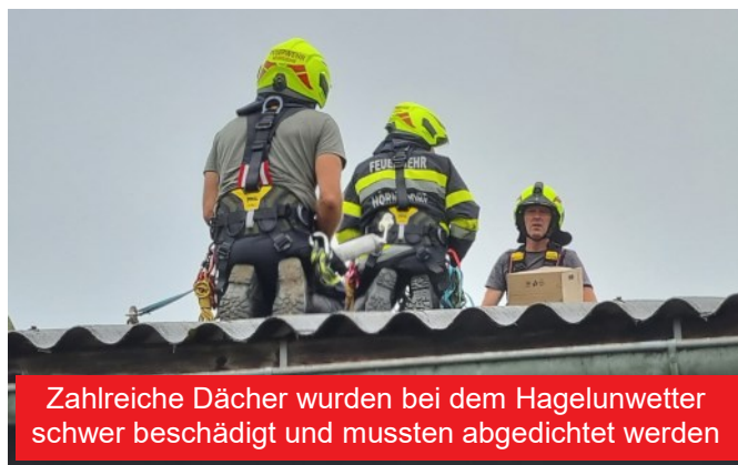
Zahlreiche Dächer wurden bei dem Hagelunwetter schwer beschädigt und mussten abgedichtet werden

Mehrere Dächer wurden bei einem schweren Hagelunwetter am späten Nachmittag am 21.06. in Eibiswald beschädigt. Um 16.10 Uhr wurde die FF Eibiswald, um 16.44 Uhr unsere Feuerwehr zur Unterstützung zum Unwettereinsatz alarmiert. Mit insgesamt 14 Mann und zwei Fahrzeugen rückten wir zunächst zur ersten angegebenen Einsatzadresse aus. Dort wurden drei Kameraden von uns zur Unterstützung bei der Absturzsicherung beim Abdichten des Daches abgestellt. Die restliche Mannschaft rückte zu zwei weiteren Einsatzadressen ab. An der ersten Einsatzadresse wurde das Dach eines Wohnhauses notdürftig von innen über den Dachboden mit PU-Schaum abgedichtet.