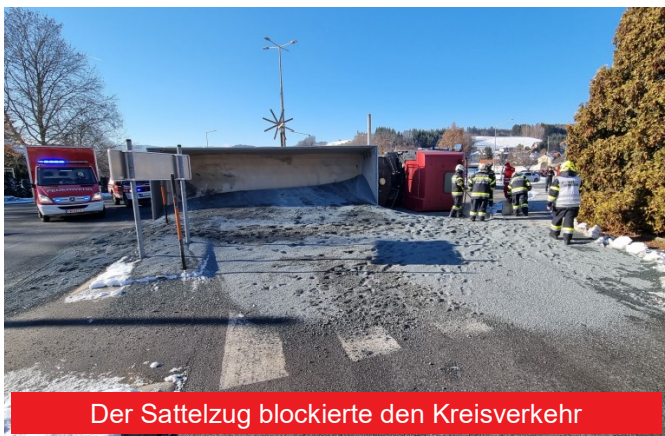
Der Sattelzug blockierte den Kreisverkehr

Der Fahrer konnte sich selbst aus dem verunfallten Fahrzeug befreien und blieb äußerlich unverletzt. Von Seiten der Feuerwehr wurde ein Brandschutz errichtet und ausgelaufene Betriebsmittel gebunden. Nachdem das Ladegut von der Straßenmeisterei und einem Fuhrunternehmen entfernt worden war, begannen die Bergungsarbeiten. Zunächst wurde der Sattelaufleger mit einem angeforderten Kran von der Zugmaschine getrennt. Diese wurde in weiterer Folge mit der Seilwinde des Eibiswalder Schwere Rüstfahrzeuges aufgerichtet und mit dem Kran auf einen Tieflader verladen. Der noch fahrtaugliche Auflieger wurde durch eine andere Zugmaschine abgeholt.