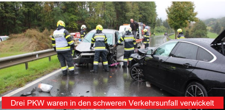
Drei PKW waren in den schweren Verkehrsunfall verwickelt

Nach rund zwei Stunden konnte die Einsatzstelle wieder für den Verkehr freigegeben werden. Insgesamt standen 26 Feuerwehrleute mit acht Fahrzeugen im Einsatz, unsere Feuerwehr war mit drei Fahrzeugen und acht Mann vor Ort.