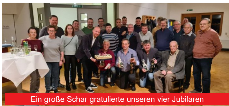
Ein große Schar gratulierte unseren vier Jubilaren

Nach dem offiziellen Teil, bei dem es neben den Geschenken seitens der Feuerwehr auch eine von unserer Kassierin selbstgebackene Geburtstagstorte gab, waren die Feuerwehrleute von den Geburtstagskindern zu Essen und Getränken eingela-