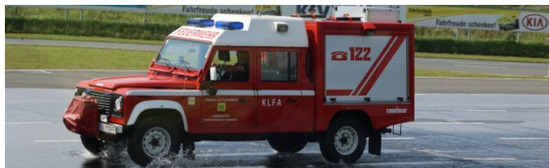
Ein Stück sicherer unterwegs bei Einsatzfahrten nach dem Fahrsicherheitstraining

Ein besonderes Highlight gab es für die Maschinisten im vergangenen Jahr. Neben den internen Schulungen auf Fahrzeug und Geräte hatten zwölf Kameradinnen und Kameraden an fünf Terminen die Gelegenheit das Handling von Tanklösch- und Kleinlöschfahrzeug in Gefahrensituationen im Fahrsicherheitszentrum des ÖAMTC in Lang-Lebring zu lernen und praktisch zu üben, ein enormer Sicherheitsgewinn für zukünftige Einsatzfahrten.