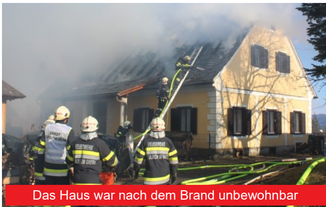
Das Haus war nach dem Brand unbewohnbar

Um 15.13 Uhr wurde unsere Feuerwehr gemeinsam mit der FF Pitschgau-Haselbach und der FF Oberhaag alarmiert, nachdem bereits um 15.01 Uhr die Freiwilligen Feuerwehren St. Ulrich im Greith, Pöfing-Brunn und Wies, zunächst nach Pitschgauegg, im Löschbereich der FF St. Ulrich alarmiert worden waren. Zeitgleich, wie beim Alarmstichwort "B12 - Wohnhausbrand" vorgesehen, wurden auch das bei der FF Wildbach stationierte Einsatzleitfahrzeug und das bei der BtF Magna stationierte Atemschutzfahrzeug des Bereichsfeuerwehrverbandes Deutschlandsberg zum Einsatz alarmiert.