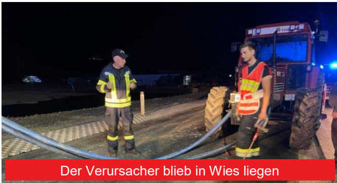
Der Verursacher blieb in Wiese liegen

Auf zwei Kilometer, von der Firma Kendrion bis zum Kreisverkehr in Aibl arbeitete unsere Mannschaft der FF Eibiswald auf Anweisung der Einsatzleitung hin beim Binden der Betriebsmittel entgegen. Es wurde Ölneutralisationsmittel aufgebracht und anschließend die Straße mit der Straßenwaschanlage des Tanklöschfahrzeugs gereinigt. Während der Arbeiten wurde der Verkehr in den jeweiligen Bereichen wechselseitig angehalten oder, wo möglich umgeleitet, bzw. musste an einigen Stellen der Verkehr kurzfristig komplett angehalten werden. Aufgrund der Uhrzeit und dem damit verbundenen geringen Verkehrsaufkommen kam es allerdings zu keinen nennenswerten Behinderungen.