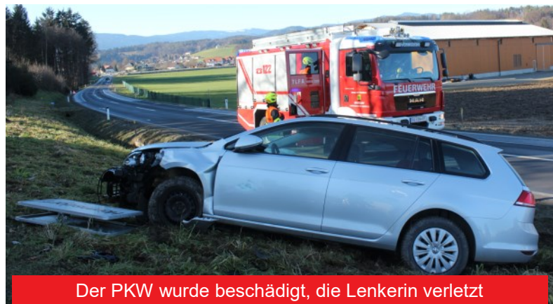
Der PKW wurde beschädigt, die Lenkerin verletzt

Beim Eintreffen unserer neun mit Tanklösch- und Kleinlöschfahrzeug ausgerückten Einsatzkräfte wurde die Lenkerin bereits vom Roten Kreuz versorgt. Aus dem PKW, der von der B69 abgekommen war und eine Ortstafel sowie eine Straßenlaterne aus der Verankerung gerissen hatte, traten keine Betriebsmittel aus.