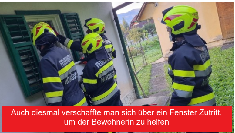
Auch diesmal verschaffte man sich über ein Fenster Zutritt, um der Bewohnerin zu helfen

Die Polizei war beim Eintreffen unserer Mannschaft mit dem Tanklöschfahrzeug ebenfalls bereits am Einsatzort. Die vor Ort befindlichen Einsatzkräfte hatten die Zugangsmöglichkeiten erkundet, abgesehen davon standen unsere Feuerwehrleute nicht zum ersten Mal vor der selben verschlossenen