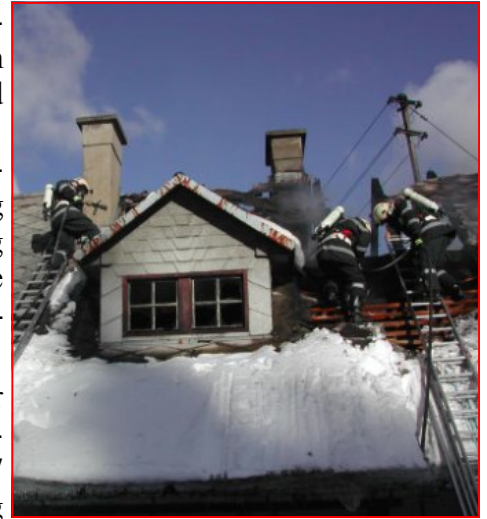
Unter schwerem Atemschutz mussten die Feuerwehrleute den Brand bekämpfen

Aufgrund der nicht vorhandenen Löschwasserversorgung war es notwendig mehrere Tanklöschfahrzeuge vor Ort zu haben. Die Brandbekämpfung selbst erforderte den Einsatz mehrerer Atemschutztrupps, bis endgültig Brand aus gegeben werden konnte. Ein Bewohner erlitt bei dem Brand eine Rauchgasvergiftung, die Feuerwehren standen rund sechs Stunden im Einsatz.