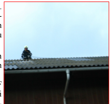
Wiederum musste ein Dach abgedichtet werden

Am 30.05. folgte der nächste Sturmeinsatz. Auch diesmal galt es wieder ein beschädigtes Dach notdürftig zuzudecken, um ein einregnen in das Wirtschaftsgebäude zu verhindern.