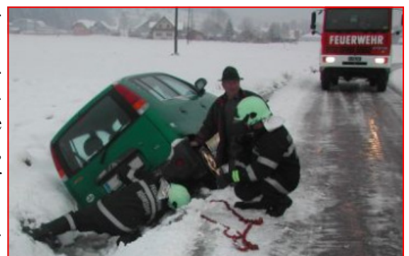
Fahrzeugbergung beim Freibad

Der Wintereinbruch am 28.11.2008 sorgte wieder für Einsätze unserer Feuerwehr. Am 28.11. wurden wir um 19.26 Uhr per stillem Alarm zu einer Fahrzeugbergung auf die „Petarhöhe“ gerufen, hier