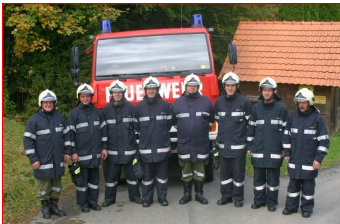
Weitere acht Mann unserer Feuerwehr sind nun „ausgezeichnet“ ausgebildet auf dem Gebiet des schweren Atemschutzes