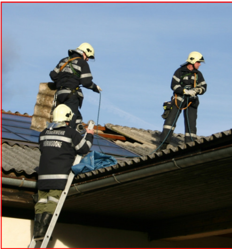
Das beschädigte Dach wurde, nach Aufbau der Seilsicherung wieder notdürftig zugedeckt

Am 27.01. fegte Sturm Paula über Europa. Unsere Gegend wurde zwar größtenteils verschont, kleinere Schäden blieben aber nicht aus. Um 12.27 Uhr erfolgte die stille Alarmierung unserer Feuerwehr. In Feisternitz wurde ein Hausdach abgedeckt.