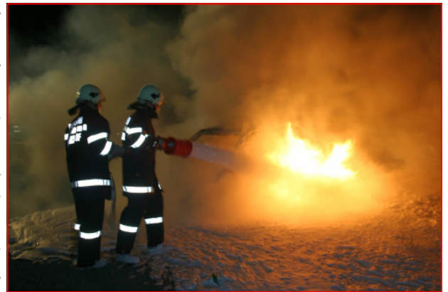
Fahrzeugbrand bei der 2-Tages-Übung

Einen weiteren Höhepunkt gab es 2008 mit dem viertägigen Bezirksjugendzeltlager, vom 24.07. bis 27.07., am Gelände des Schlosses Limberg. Weit über 100 Jugendliche