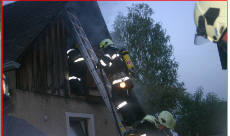
Technische Einsatzübung im Juli und Brandeinsatzübung im Oktober, beide Male stand eine Menschenrettung auf dem Programm