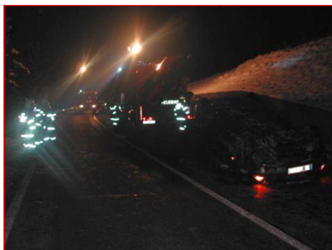
Der Lenker blieb bei dem Unfall unverletzt

Zur schonenden Fahrzeugbergung wurde, nach absichern und ausleuchten der Unfallstelle, sowie dem Aufbau des Brandschutzes, die FF Eibiswald mit dem Schweren Rüstfahrzeug nachalarmiert.