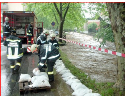
Die Hochwasser führende Laßnitz in Deutschlandsberg

Zwei Mann unterstützen mit dem MTF und dem Anhänger die Einsatzkräfte bei logistischen Aufgaben, wie der Abholung von Sandsäcken aus dem Katastrophenlager der Feuerweherschule in Lebring.