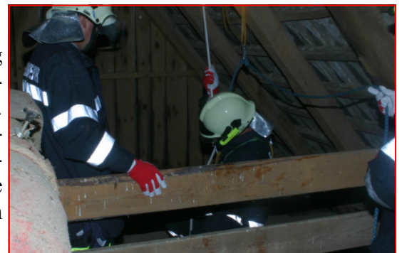
Ein Kamerad seilt sich zur Rettung einer Person aus einem Schacht ab

Um auch unsere Führungskräfte bestmöglich zu schulen, wurden 2008 erstmalig Planspiele abgehalten, bei denen unsere Gruppenkommandanten und Einsatzleiter fiktive Einsätze bewältigen mussten. Nach den Planspielen wurde jeweils über die angewandte Einsatztaktik und eventuelle Verbesserungsmöglichkeiten diskutiert.