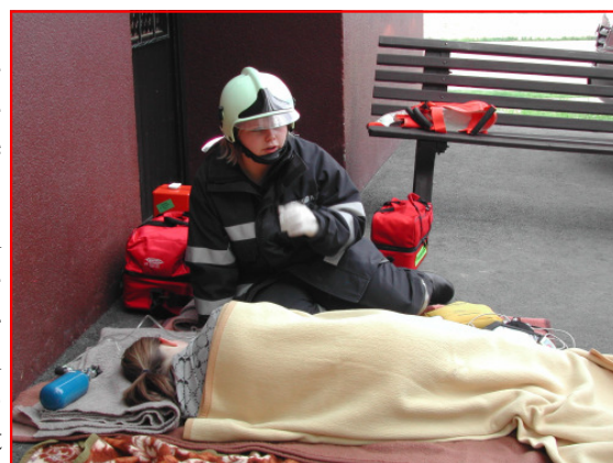
Zahlreiche Verletzte galt es beim Behindertenheim zu versorgen

Das Bedienen des Strahlrohres machte den Kindern sichtlich Spaß